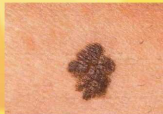
B - rubovi (border)