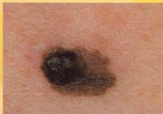
A - asimetrija (asimmetry)