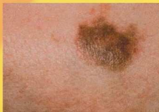
C - boja (colour)